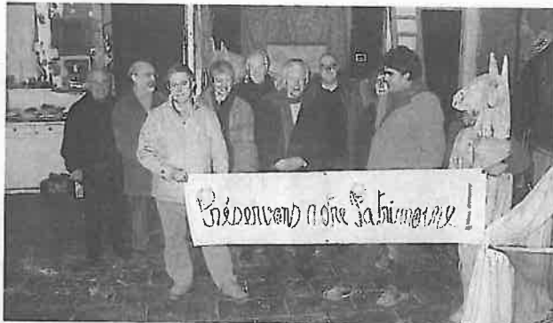
Les associations, La Sauvegarde de l'Anjou, la Réverie des Allumettes et Adduit, continuent de se mobiliser sur le projet d'urbanisation de l'ancienne manufacture des allumettes.