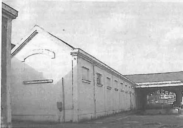
La halle J, ancienne halle de cartonnerie, sera vraisemblablement rasée dans les jours prochains.

Le site de l'ancienne manufacture d'allumettes, situé aux portes d'Angers, d'une superficie de 6 hectares dont 2 de bâtiments, n'en finit pas de déchaîner des passions. Le dernier ensemble industriel de la première moitié du XX e siècle encore visible dans l'agglomération d'Angers, a attiré l'attention du ministère de la Culture.