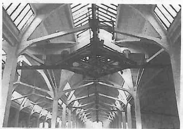
Aiguillage typique des allumettes où un chariot reliait les ateliers qui communiquaient en hauteur par un système de rails pour transporter les matériaux.