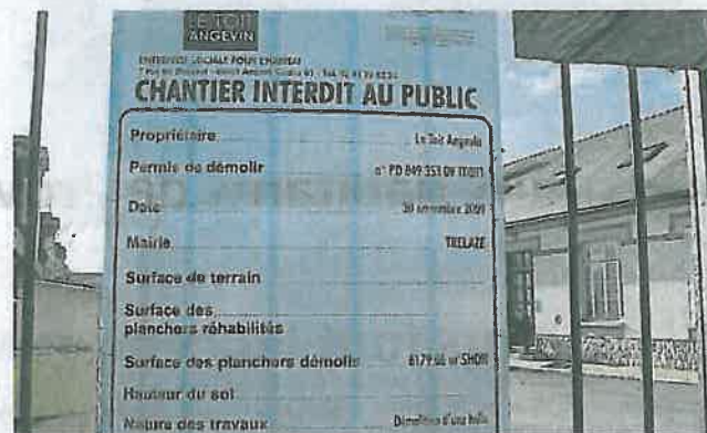
L'objet du conflit. Accordé le 30 novembre mais affiché sur les grilles d'entrée de la Manufacture des Allumettes le 25 janvier ; les défenseurs du site estiment que cette découverte du permis de démolir ne relève surtout pas de la concertation.

Le 8 février prochain, la halle des cartonniers n'existera plus. Les manifestants d'hier participeront néanmoins au comité de concertation mis en place par la mairie. Avec la ferme volonté de ne pas être enfumés une seconde fois, comme ils ont le sentiment de l'avoir été en découvrant, en début de semaine dernière, le permis de démolir placardé à l'entrée de la Manufacture des Allumettes.