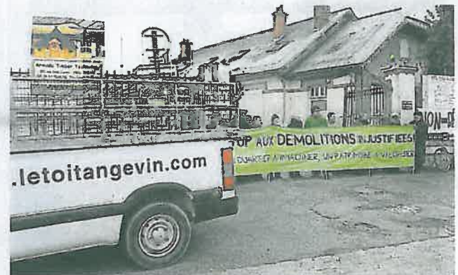
On ne passe pas. Dès 8 heures hier matin, membres de la Réverie des Allumettes et de la Sauvegarde de l'Anjou avaient établi un barrage filtrant à l'entrée de la Manufacture. Ils n'ont pas autorisé les véhicules du Toit Angevin à le franchir.