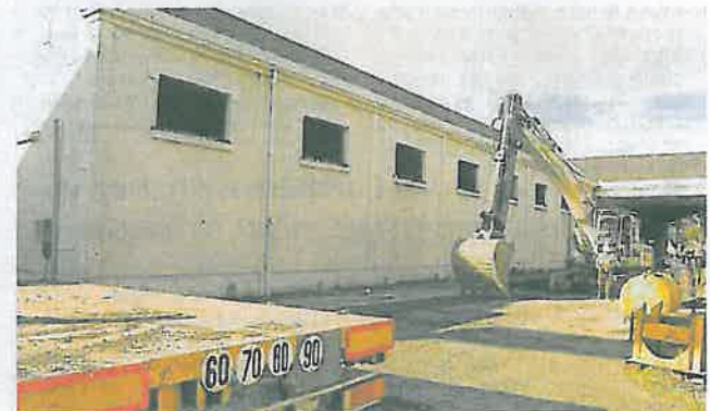
La pelleuse en place. Peu avant 13 heures, les manifestants ont levé le barrage. A 14 heures, les plateaux transportant les engins de démolition passaient le portail. Dès 15 heures, la pelleuse était opérationnelle près de la halle des cartonniers.