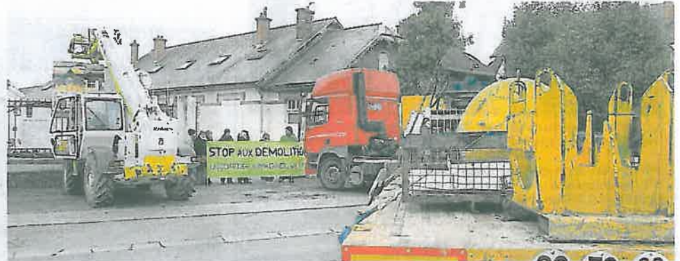
Trélazé, entrée de la Manufacture des Allumettes, hier matin. Une première fois refoulés en matinée, les camions transportant les engins de démolition sont entrés sur le site vers 14 heures, après le départ des manifestants.