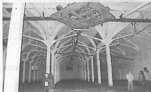
Située sur la droite de l'axe central du site par rapport à l'entrée de la rue Jean-Jaurès, la halle des cartonniers sera vouée à la démolition la semaine prochaine.

Le calendrier des interventions n'est pas le fait du hasard. « Les cartonniers nous ont rendu les clés le 31 juillet. Le permis de démolir a été accordé le