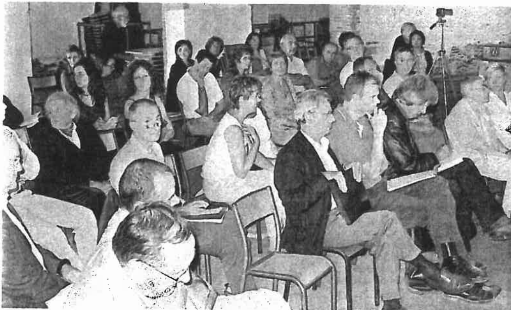
Le devenir de la manu, objet de débat, samedi.

Samedi, dans le cadre des journées du patrimoine, une rencontre était proposée sur le thème de « l'art, la friche, la ville ». Une cinquantaine de personnes ont entendu les intervenants. Mais, visiblement, une partie du public était préoccupée par le devenir proche de l'ensemble du site de l'ancienne manufacture d'allumettes, et surtout ce qu'il allait advenir des ateliers d'artistes actuellement occupés. Achetés il y a près de 25 ans par un propriétaire privé pour 2 millions de francs, l'ensemble de 6 hectares et les bâtiments, ont été revendus au Toit Angevin il y a quelques mois « pour 3,7 millions d'euros, précise Marc Goua, le maire. Il ajoute : « La ville ne pouvait pas mettre ce prix. » Une opération de construction est donc en projet avec à terme quelque 400 logements. A juste titre, sans doute, les artistes, qui y ont actuellement leur ateliers, se posent quelques questions. « Ce n'est pas, interrogeait l'un d'eux, la défense corporatiste de nos petits ateliers d'artistes qui nous préoccupe, mais bien le fait qu'il faille une vraie mixité sociale sur ce site. »